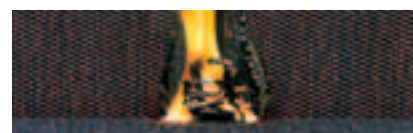
Für den Objektbereich werden Tests mit unterschiedlichen Zündquellen vorgeschrieben – wie dieser mit einem brennenden Holzstapel auf dem Möbelpolster (BS 5852 II, crib 5).