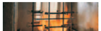
Grundlage der Marke Trevira CS ist die Erfüllung der strengen Bedingungen nach DIN 4102, Klasse B1, schwer entflammbar.