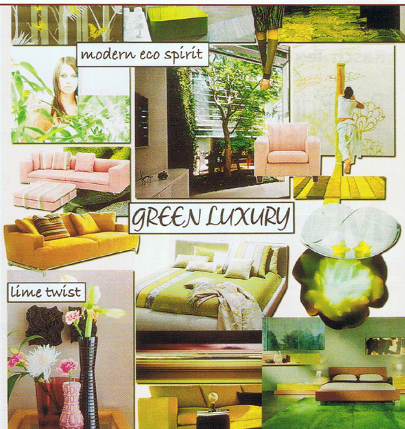
Frische Grüntöne dominieren das neue Trendthema „Green Luxury“ und sorgen für Frühlingsstimmung in den eigenen vier Wänden